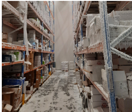
Zeminde, raflarda ve ürünlerde buz ve kar oluşur.