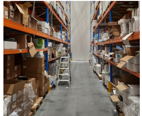
Munters kapsamlı çözümünü sayesinde soğuk depolamada daha güvenli çalışma ortamı.