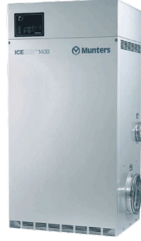
Munters IceDry 1400

Munters ML1100 , suyla yapılan her temizlikten sonra çiğlenme noktasını hızla düşürerek dondurucuya yakın üretim alanındaki nemi kontrol eder. Temizlikten sonra kurutma, dondurucuya giden nem yükünü önemli ölçüde azaltır ve kuru hava aynı zamanda çok daha kolay yönetilebilir bir mikrop oranı ve üretim alanında daha iyi hijyen temizliği sağlar.