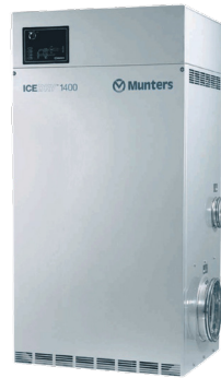
Munters IceDry 1400

Munters ML1100 controlla l'umidità nell'area di produzione adiacente al congelatore abbassando rapidamente il punto di rugiada dopo ogni pulizia con acqua. L'asciugatura dopo la pulizia riduce drasticamente il carico di umidità nel congelatore e grazie all'aria secca il numero di germi è molto più gestibile; inoltre migliorano igiene e pulizia nell'area di produzione stessa.