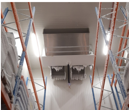
L'umidità e il ghiaccio minacciano l'ambiente di lavoro nella cella di congelamento.