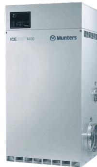
Der Munters IceDry 1400

Der Munters IceDry 1400 wurde speziell für die Installation in Tiefkühlräumen entwickelt und bietet zwei wesentliche Vorteile. Durch die Absenkung des Taupunkts wird verhindert, dass Wasserdampf in die Tiefkühlzelle wandert und sich in Eis und Schnee verwandelt. Darüber hinaus sublimiert der IceDry alle bereits vorhandenen Schnee- und Eismengen, was zu einer sicheren Arbeitsumgebung und mehr Effizienz führt.