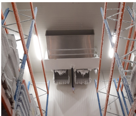
Feuchtigkeit und Eis gefährden die Arbeitsumgebung im Tiefkühlraum.

Quisquater Geschäftsführer Maxim Seghers