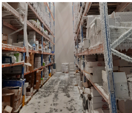
Eis und Schnee auf dem Boden, den Regalen und den Produkten.