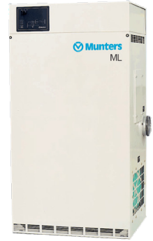
Der Munters ML1100

Der Munters ML1100 kontrolliert die Feuchtigkeit im Produktionsbereich neben dem Tiefkühlraum, indem er den Taupunkt nach jeder Reinigung mit Wasser schnell senkt. Durch das Trocknen nach der Reinigung wird die Feuchtigkeitsbelastung des Tiefkühlers drastisch reduziert, und die trockene Luft sorgt auch im Produktionsbereich selbst für eine viel besser handhabbare Keimanzahl und verbesserte Hygiene.