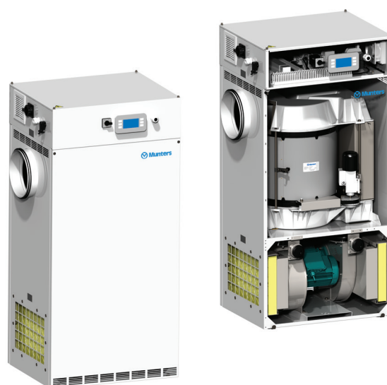
ML med Climatix

ML-seriens avfuktare tillverkas i enlighet med harmoniserade Europeiska Standarder och är CE märkt.