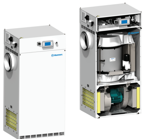
ML con control Climatix

Los deshumidificadores de la serie ML se fabrican siguiendo los estándares europeos y cumplen con las directrices técnicas de la CEE.