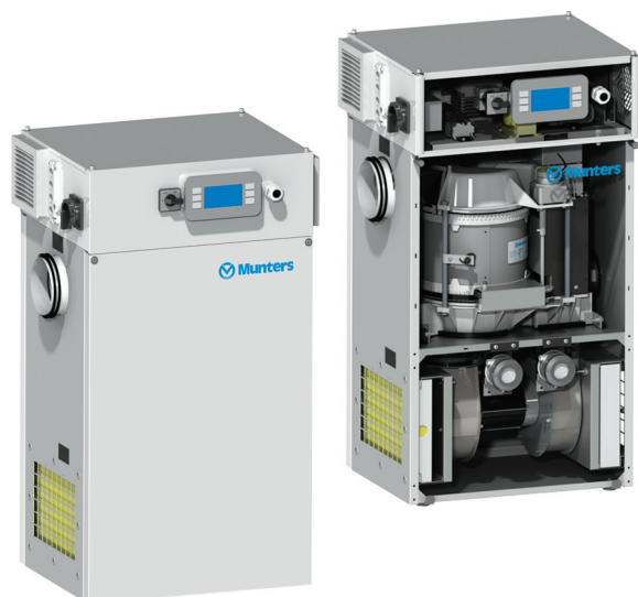
ML con controllo Climatix

I deumidificatori della serie ML sono conformi alle norme armonizzate europee ed alle specifiche tecniche previste per il marchio CE.