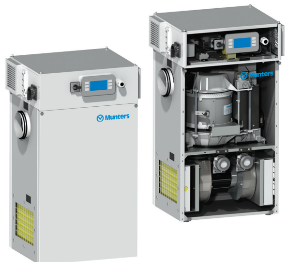
ML con control Climatix

Los deshumidificadores de la serie ML se fabrican siguiendo los estándares europeos y cumplen con las directrices técnicas de la CEE.