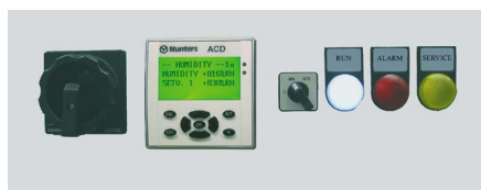
El controlador ACD/ICD instalado en los deshumidificadores ML17, ML23 y MLT30 fabricados entre 2005 y 2015 está obsoleto.